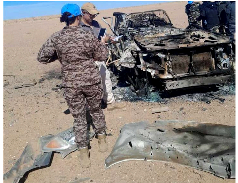
Le 13 août 2023, Zone interdite, Sahara marocain.

obligés à quitter la zone tampon, où les forces de la Minurso sont censées d'en chasser le Polisario.