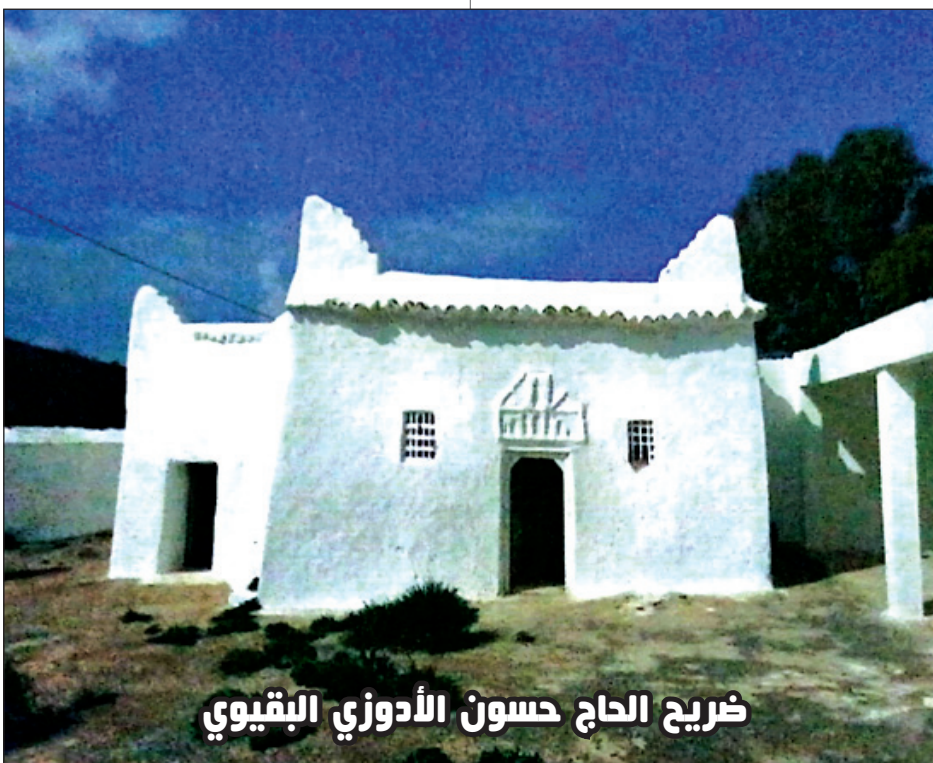
ضريح الحاج حسون الأدوزي البقيوي

كما أن جمال الديانة يظهر جلياً في السلوك والمعاملة، فالدين الحق يثمر خلقاً، ويولد من رحم العبادة روحاً رحيمة، ولساناً صادقاً، وقلباً نقياً، فالأخلاق هي مرآة العبادة، فإذا صلى الإنسان ولم تنته صلواته عن الفحشاء والمنكر، أو صام ولم يتحل بالصبر والرفق، فإن ذلك أمانة على وجود علة واضطراب. وفي هذا السياق الأخلاقي يقول الإمام الرزاي في تفسيره لقوله تعالى: «وَإِنَّكَ لَعَلَى خَلْقٍ عَظِيمٍ» (القلم/04)، «الخلق ملكة نفسانية يسهل على المتصف بها الإتيان بالأفعال الجميلة. وأعلم أن الإتيان بالأفعال الجميلة غير سهوولة الإتيان بها غير، فالحالة التي باعتبارها تحصل تلك السهوولة هي الخلق، ويدخل في حسن الخلق التحرز من الشح والبخل والغضب، والتشديد في المعاملات والتحبب إلى الناس بالقول والفعل، وترك التقاطع والهجران والتساهل في العقود كالبيع وغيره والتسامح بما يلزم من حقوق من له نسب أو كان صهراً له وحصل له حق آخر. وروي عن ابن عباس أنه قال: معناه: وإنك لعلى دين عظيم» (8).