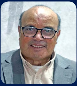
• محمد بن يعقوب